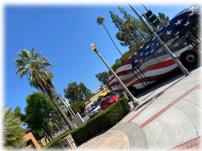
↑ Riverside内のバス。 UCRの学生であれば無料。