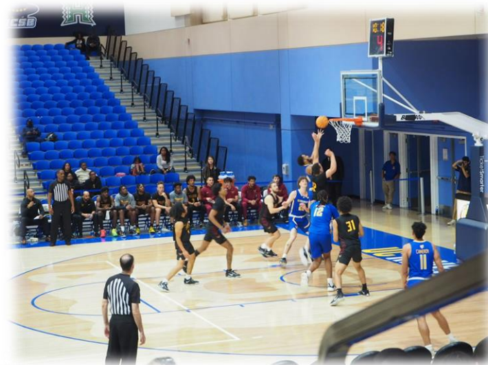
↑ UCRとUC他校とのバスケマッチ。 定期的に試合が行われる。